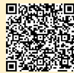
「ラーケーションの日」 ポータルサイト

※ 県の Web ページ「ラーケーションの日」ポータルサイトには、計画づくりに活用できる「ラーケーションカード」や、様々な学びを体験できるスポットを紹介していますので、参考にしてください。