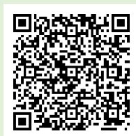
「ラーケーションの日」 ポータルサイト

「ラーケーションの日」には、様々な活動ができます。どのような活動ができるのか、どうやって「ラーケーションの日」を取ればよいのかなど、興味をもった人は、おうちの方に配った「保護者用リーフレット」を見たり、右の二次元コードから、「ラーケーションポータルサイト」を見たりしながら、おうちの方と話し合ってください。